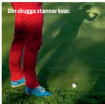
Din skugga stannar kvar.

www.lidingögk.se • jochum@lidingögk.se • tel: 08-731 79 00