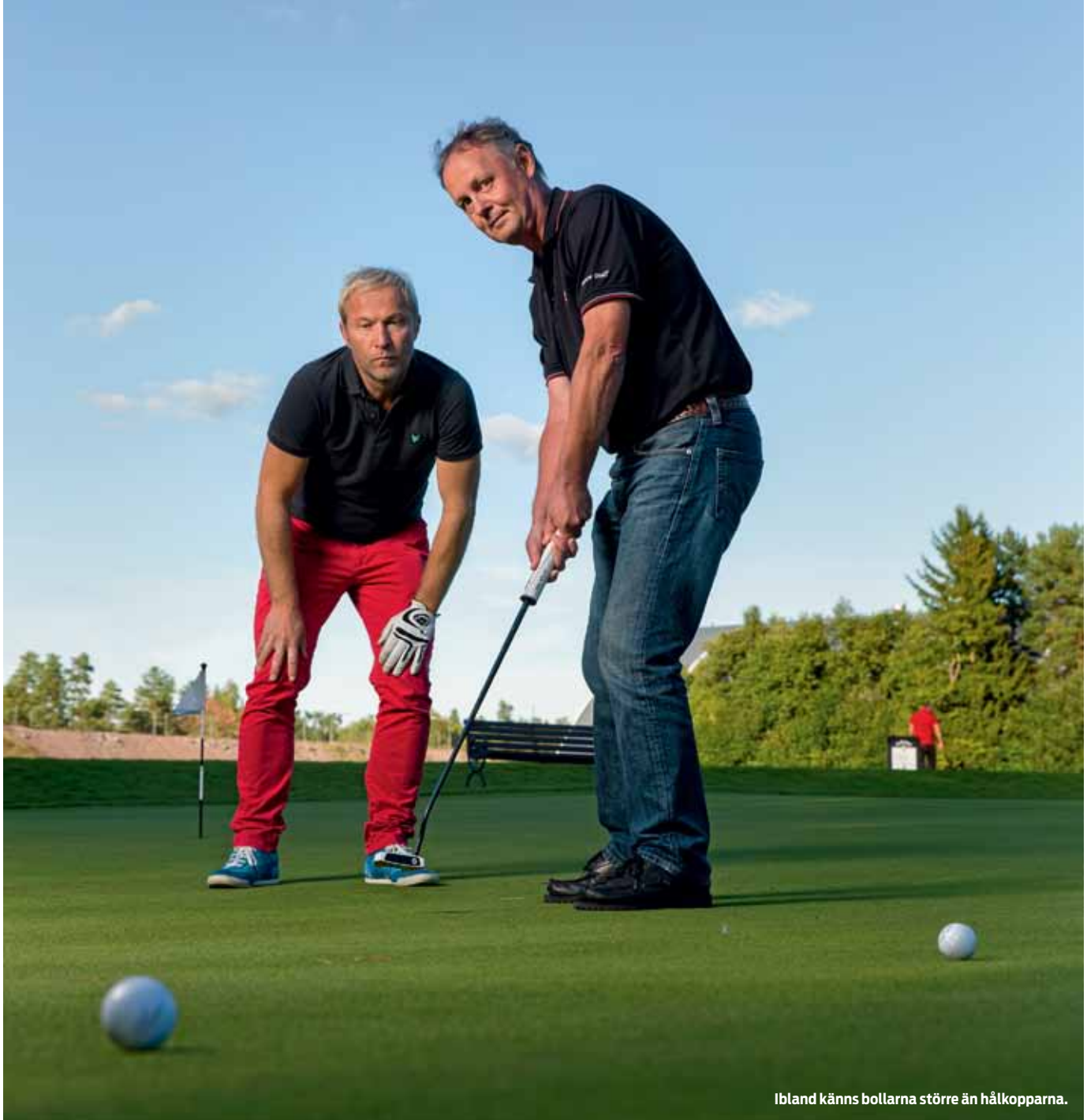
Ibland känns bollarna större än hålkopparna.